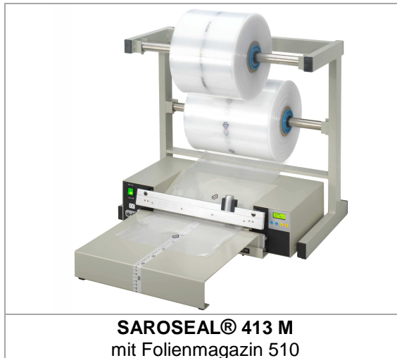
SAROSEAL® 413 M mit Folienmagazin 510

Ergänzt um einen Anstecktisch, einen Folienabroller oder ein Folienrollen-Magazin werden diese SAROSEAL® Magnet-Tischschweißgeräte bestimmt auch bei Ihnen schnell zu unentbehrlichen Helfern.