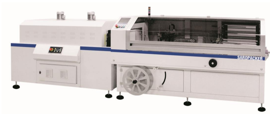
Layout SAROPACKER 800HS, 80HS Servo