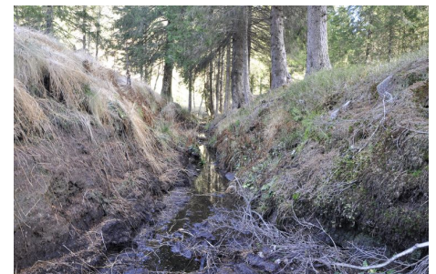
Entwässerungsgraben. Diese werden bei einer Wiedervernässung zugeschüttet.