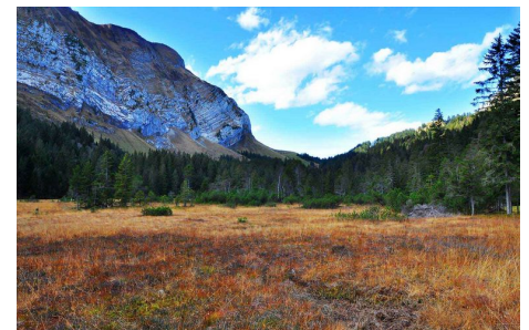
Das Gross Moos im Herbst.