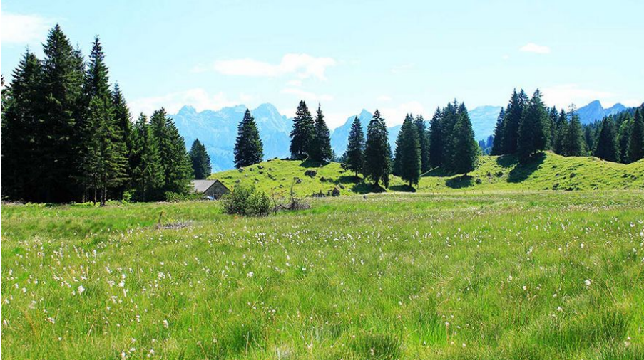
Das Gross Moos im Schwändital im Sommer.

Dank des Projektes kann das Hochmoor im Glarner Schwändital renaturiert werden, womit weniger Treibhausgas in die Atmosphäre gelangt. Aber nicht nur der Klimaschutz profitiert von einer Wiedervernässung, sondern auch die Biodiversität, der Wasserhaushalt und die lokale Baubranche.